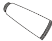
Silicone Sealant Enduit d'étanchéité au silicone Sellador de silicona